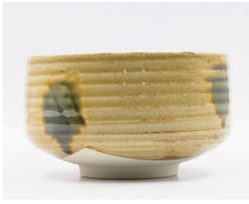
022-19 忠作 黄瀬戸茶碗 (11.8×7.3) (段) ¥2,750(本体価格 ¥2,500)