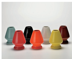
022-36 茶笥立て (6×8) (段) (黒・白・青磁・黄・茶・オレンジ・赤) ¥1,265(本体価格 ¥1,150)