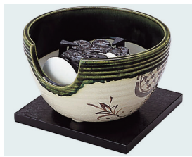
022-47 紅鉢風炉 織部半掛 (裏流・表流) (28.5×16.5) (段) ¥79,750(本体価格 ¥72,500)