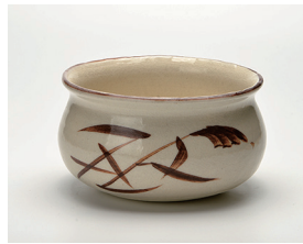
022-32 忠作 志野建水 (13.5×8) (段) ¥3,080(本体価格 ¥2,800)