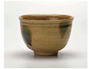
022-14 景陶作 黄瀬戸井戸茶碗 (12×8) (化) ¥8,800(本体価格 ¥8,000)