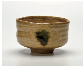
022-16 景陶作 黄瀬戸茶碗 (11.8×7.8) (化) ¥8,800(本体価格 ¥8,000)