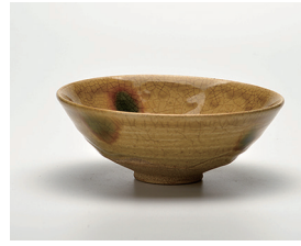
022-02 景陶作 黄瀬戸平茶碗 (14.8×5.6) (化) ¥8,800(本体価格 ¥8,000)