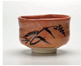
022-18 景陶作 紅志野茶碗 (11.8×7.8) (化) ¥8,800(本体価格 ¥8,000)