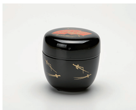
022-40 P.C 糞黒 (柄は変わります) (6.5×6.6) (紙) ¥1,650(本体価格 ¥1,500)