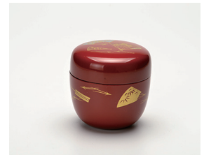
022-39 P.C 糞朱 (柄は変わります) (6.5×6.5) (紙) ¥1,650(本体価格 ¥1,500)