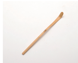
022-38 国産 茶杓 (8.5cm) ¥1,265(本体価格 ¥1,150)