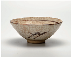
022-04 景陶作 志野平茶碗 (14.8×5.6) (化) ¥8,800(本体価格 ¥8,000)