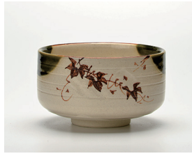
022-20 忠作 織部茶碗 (11.8×7.3) (段) ¥2,750(本体価格 ¥2,500)