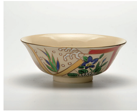
022-06 隆山作 色絵色紙平茶碗 (14×5) (化) ¥5,500(本体価格 ¥5,000)