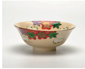
022-05 隆山作 色絵雲錦平茶碗 (14×5) (化) ¥5,500(本体価格 ¥5,000)