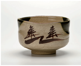
022-15 景陶作 織部茶碗 (11.8×7.8) (化) ¥8,800(本体価格 ¥8,000)