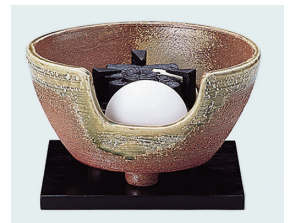
022-49 紅鉢風炉 信楽 (裏流・表流) (28.5×15.5) (段) ¥70,950(本体価格 ¥64,500)