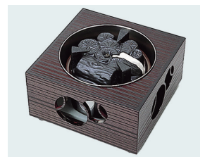
022-50 箱風炉 (電気炭付・裏流・表流) (23cm 角×12.5) (段) ¥62,480(本体価格 ¥56,800)