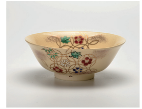
022-08 隆山作 色絵織七宝平茶碗 (14×5) (化) ¥5,500(本体価格 ¥5,000)