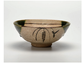
022-03 景陶作 織部平茶碗 (14.8×5.6) (化) ¥8,800(本体価格 ¥8,000)