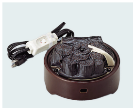
022-45 風炉用電気炭 (裏流・表流) (17×10) (段) ¥36,080(本体価格 ¥32,800)