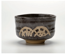
022-17 景陶作 鼠志野茶碗 (11.8×7.8) (化) ¥8,800(本体価格 ¥8,000)