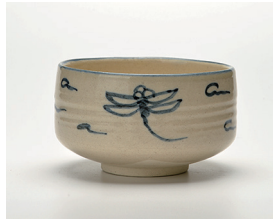
022-21 忠作 御深井茶碗 (11.8×7.3) (段) ¥2,750(本体価格 ¥2,500)