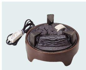
022-46 炉用電気炭 (裏流・表流) (17×14) (段) ¥36,080(本体価格 ¥32,800)