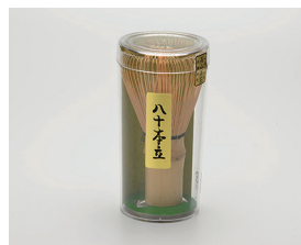
022-42 国産茶笥 80本立て (5.6×11.5) ¥9,680(本体価格 ¥8,800)