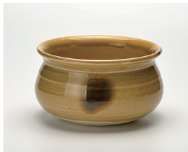
022-31 忠作 黄瀬戸建水 (13.5×8) (段) ¥3,080(本体価格 ¥2,800)