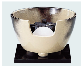
022-48 紅鉢風炉 雲華 (裏流・表流) (28.5×17) (段) ¥72,270(本体価格 ¥65,700)