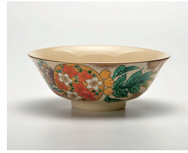
022-07 隆山作 色絵花丸平茶碗 (14×5) (化) ¥5,500(本体価格 ¥5,000)