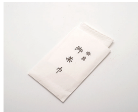
022-37 国産 並茶巾 (10×14) ¥880(本体価格 ¥800)